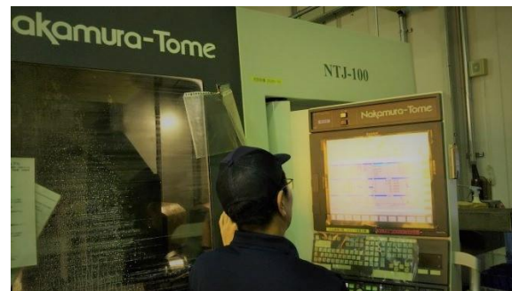
加工設備(中村留株製:NTJ-100)での NCプログラム、動作確認