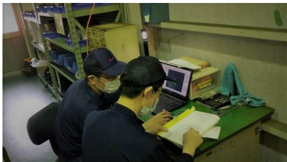
製作方法の打合せ(CADによる作図、NCプログラム検討等)