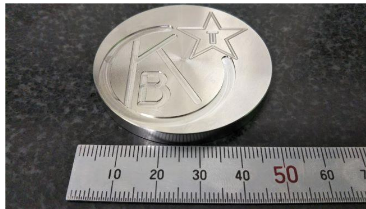
完成したロゴマーク(素材:SUS304)